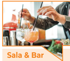
Sala & Bar