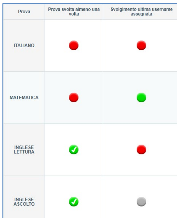
Figura 7: indicatori Svolgimento della prova per il monitoraggio della somministrazione

L'indicatore "Svolgimento ultima username assegnata" segnala se lo studente ha svolto la prova utilizzando le ultime credenziali assegnate. Ciò vuol dire che il colore dell'indicatore è legato alle richieste di modifica delle misure compensative e/o dispensative o di riabilitazione alla ripetizione di una prova eventualmente effettuate dal Dirigente scolastico.