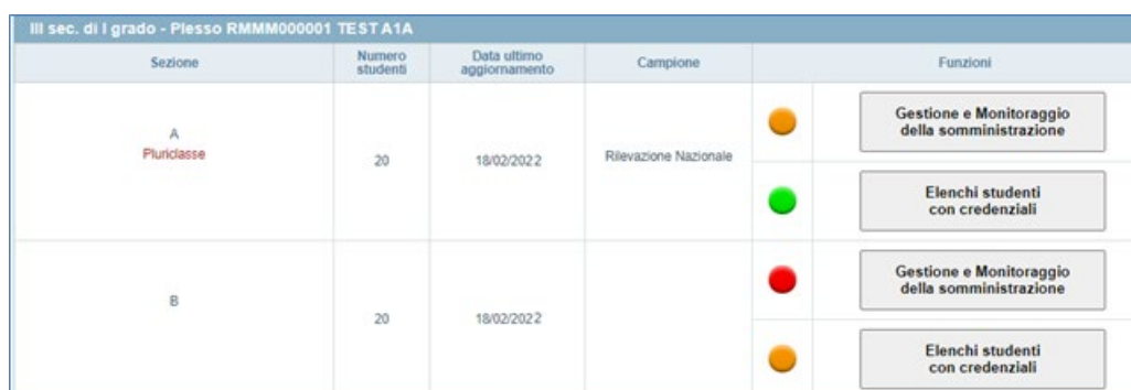
Figura 3: indicatori dei pulsanti “Gestione e Monitoraggio della somministrazione” e “Elenchi studenti con credenziali”

A partire dal secondo giorno della finestra di somministrazione specifica per l’Istituto, accanto al pulsante “Gestione e Monitoraggio della somministrazione” è presente l’indicatore relativo allo svolgimento delle prove (Figura 3).